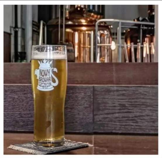
Stara Komenda Browar & Nowy Browar Szczecin

Zunächst gilt es jedoch noch, viele Dutzend Entwürfe für Blogbeiträge aufzuarbeiten, die sich in den vergangenen Monaten angehäuft haben. Auch da kommt noch die eine oder andere spannende Perle zum Vorschein. Danke ich.